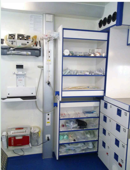
Einblick durch die seitliche Schiebetüre Insights trough the sliding door