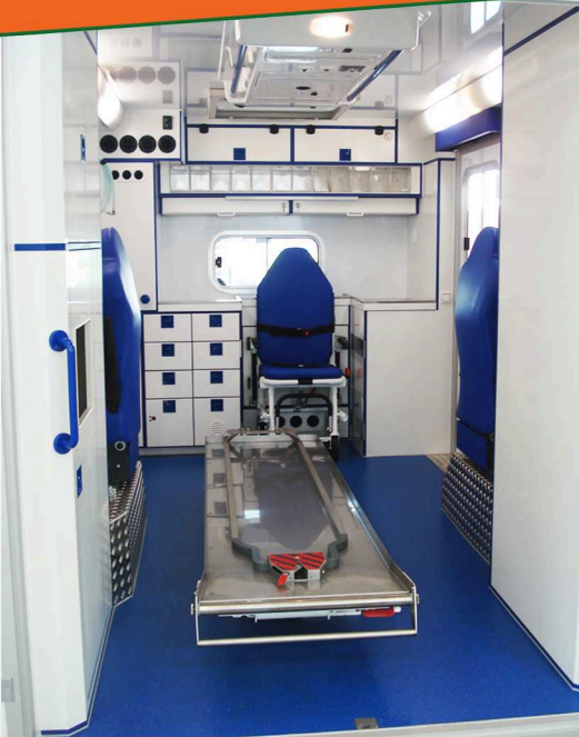
Ansicht der Trennwand View on the partition wall

MIESEN`S technically advanced interior equipment is not only unmatched for the very practical and convenient layout of the patients compartment with its patients-friendly colored interior, but also for the optimum climatic conditions prevailing in the compartment which are created by a separate heating and air conditioning system for the patients compartment. Not to forget high-stress and durable materials that were chosen in consideration of optimum disinfectability.