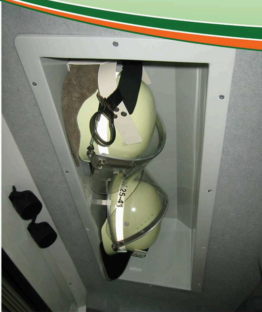
Staufach für Helme - zugänglich vom Fahrerraum Storage space for helmets - accessible from drivers cab