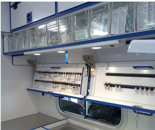
Ampullenschrank an der Trennwand Cabinet for ampoules situated at the partition wall