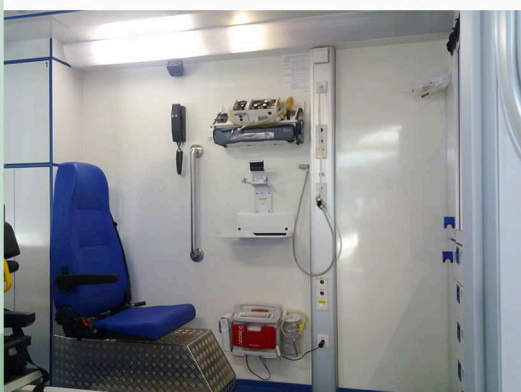
Ansicht der linken Seitenwand View on the left sidewall